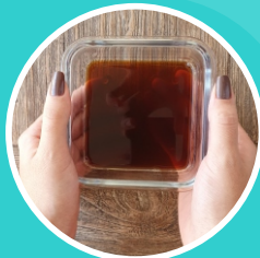
ADUBO LÍQUIDO (BIOFERTILIZANTE)

PARA UTILIZAR, DILUIR 1 PARTE DE BIOFERTILIZANTE EM 10 PARTES DE ÁGUA PARA REGAR SUAS PLANTAS.