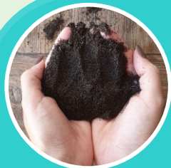
ADUBO SECO OU COMPOSTO

NOSSO LIXO ORGÂNICO COSTUMA TER MUITA UMIDADE. E NA DECOMPOSIÇÃO DESSE MATERIAL, O LÍQUIDO QUE SE SEPARA PODERÁ SER COLETADO E UTILIZADO COMO ADUBO LÍQUIDO. O RESTANTE DO MATERIAL, APÓS CERCA DE 30 A 40 DIAS ESTARÁ PRONTO PARA SER UTILIZADO COMO ADUBO SÓLIDO, CONHECIDO TAMBÉM COMO COMPOSTO ORGÂNICO. MUITO INTERESSANTE E LEGAL NÃO É MESMO?!